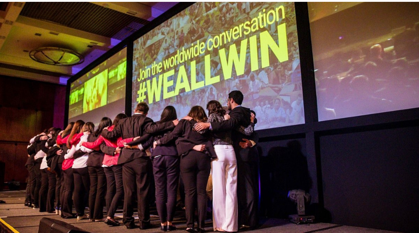
Time Enactus FACAMP no Campeonato Nacional 2015

O Time Enactus FACAMP iniciou suas atividades em outubro de 2012. Atualmente, contamos com 34 membros de 8 dos 9 cursos que a faculdade oferece. Temos 5 professores conselheiros muito engajados e 8 BABs, que contribuem para nossas decisões estratégicas e ampliam a nossa rede de relacionamentos.